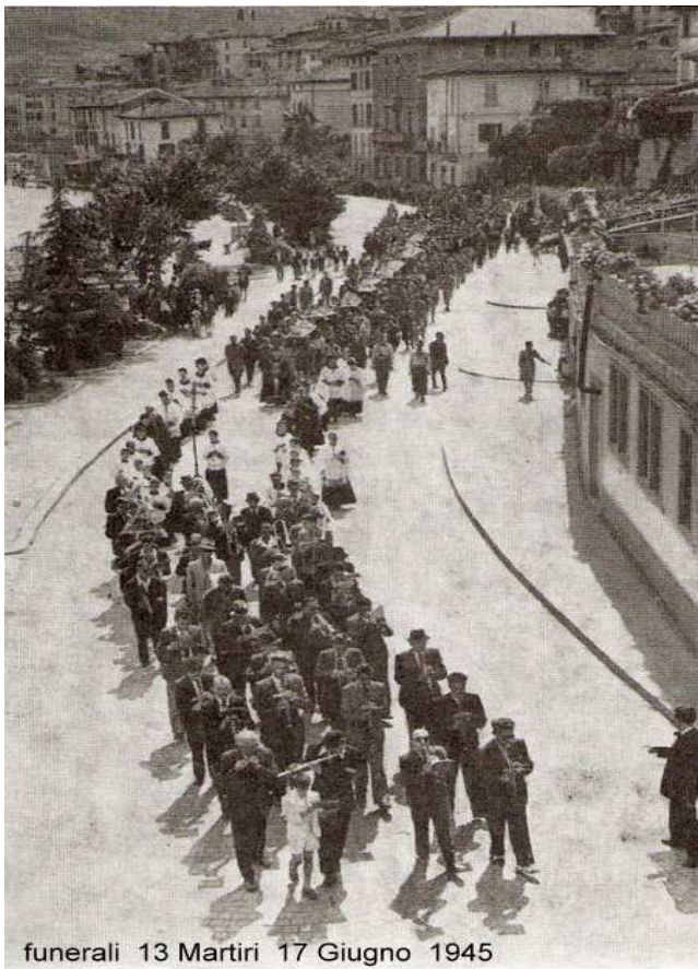
funerali 13 Martiri 17 Giugno 1945