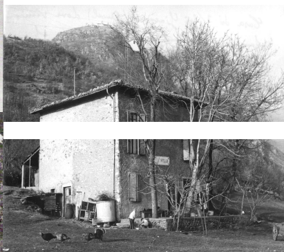
casa VOLPI Dossello